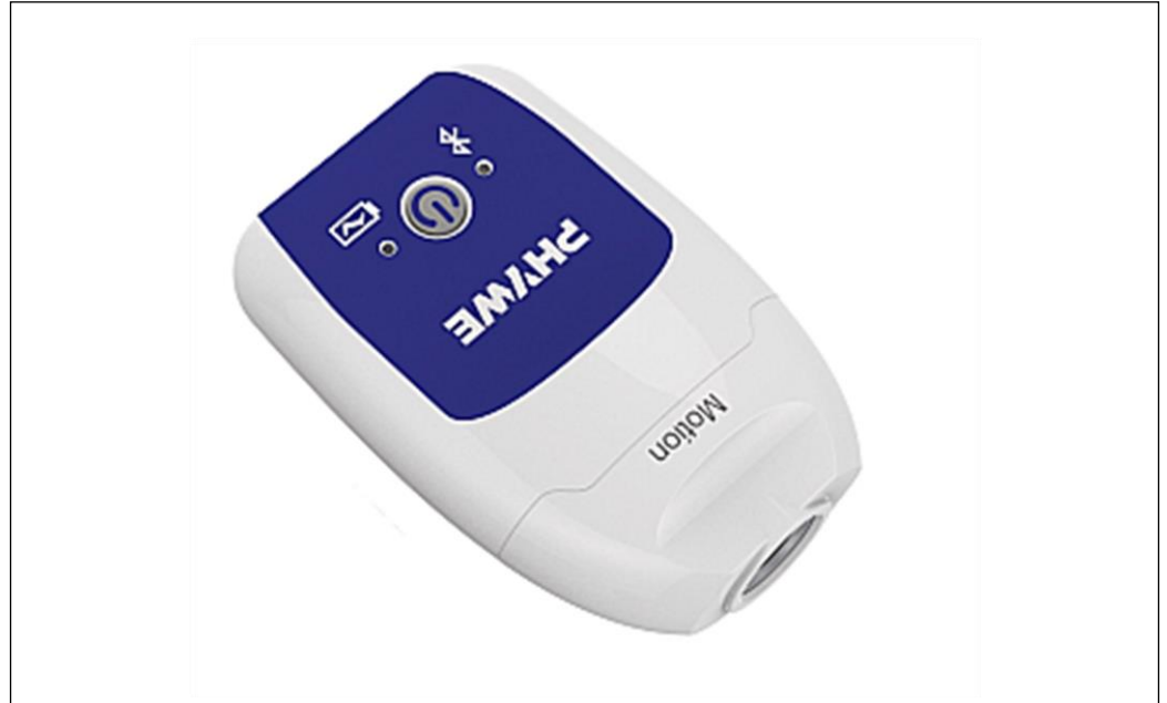
Kuva 1: 12908-01 Cobra SMARTsense liikeanturi

Yksikkö on sovellettavien EY:n suunta- viivojen mukainen.